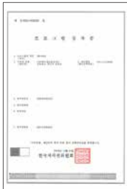
프로그램등록증 제 S2004000926호