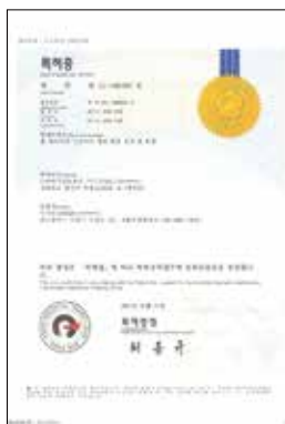
특허 제10-1060507호 풀 에이치디 크로마키 영상 합성 장치 및 방법