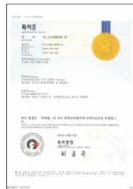
특허 제10-0989659호 지능형 로컬 방송시스템