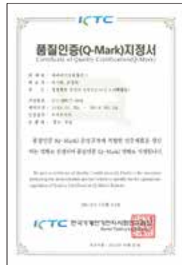
품질인증(Q-Mark)지정서 제 I54-2017-002 호