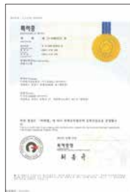
특허 제10-0881076호 방송시스템