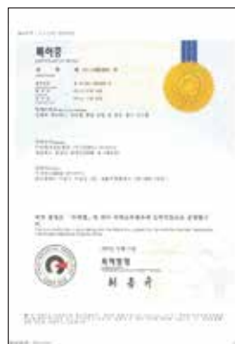
특허 제10-1080801호 입체적 매트릭스 회로를 통한 음향 및 영상 제어 시스템