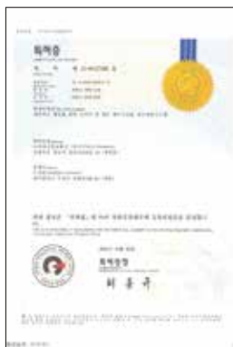
특허 제10-0417495호 매트릭스 회로를 통한 스피커 및 앰프 제어구조를 갖는 방송시스템