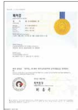
특허 제10-0362425호 스피커 개별 제어 시스템 및 이를 이용한 방송시스템