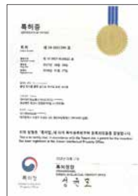
특허 제10-1821396호 음성 인식을 통한 오디오 믹서의 조정 시스템