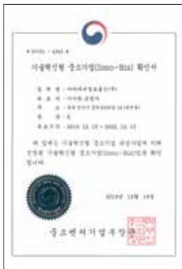
기술혁신형 중소기업 (INNOBIZ) 확인서