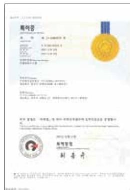
특허 제10-0881074호 로컬방송시스템