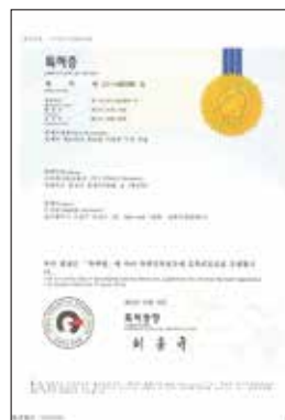
특허 제10-1406266호 입체적 매트릭스 회로를 이용한 믹싱 콘솔