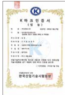
K마크인증서 제 PC12018-170 호